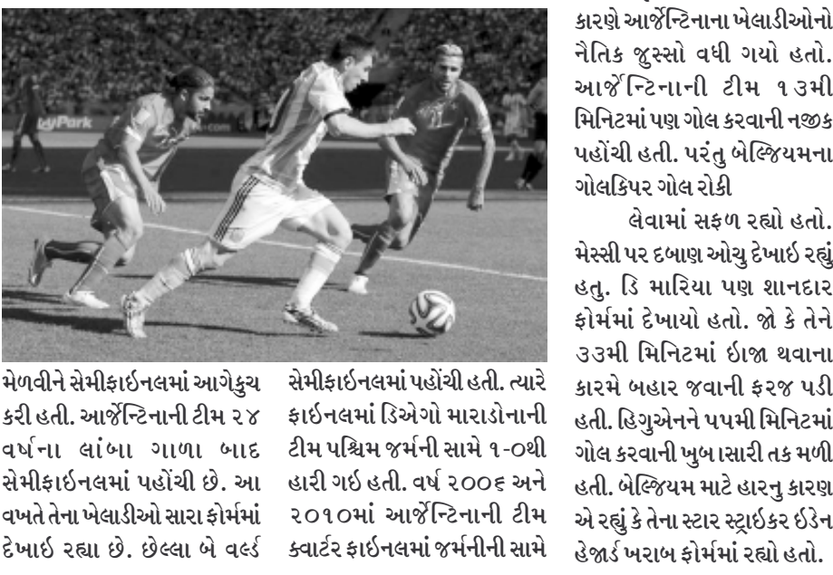
મેળવીને સેમીફાઈનલમાં અગ્રેયુ સેમીફાઈનલમાં પહોંચી હતી. ત્યારે ફાઈનલમાં ડિએગો મારાડોનાની ટીમ પશ્ચિમ જર્મની સામે ૧-૦થી હારી ગઈ હતી. વર્ષ ૨૦૦૬ અને ૨૦૧૦માં આર્જેન્ટિનાની ટીમ ક્વાર્ટર ફાઈનલમાં જર્મનીની સામે