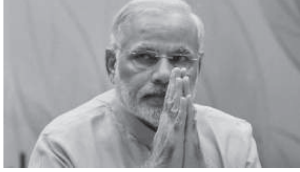
રેલીમાં તમામ નેતા હાજરી રણશિગુ કુકુનાર છે. પ્રામ અહેવાલ આપનાર છે. મુજફ્ફરપુરમાં ચક્રર મુજબ મોદીના કાર્યક્રમને લઈને

વડાપ્રધાન બન્યાના ૧૫ મહિના મેદાન ખાતે યોજનારી રેલીથી મોદી બાદ મોદી પહોંચી રહ્યા છે. મોદીની બિહારમાં ચૂંટણી પ્રચાર માટે