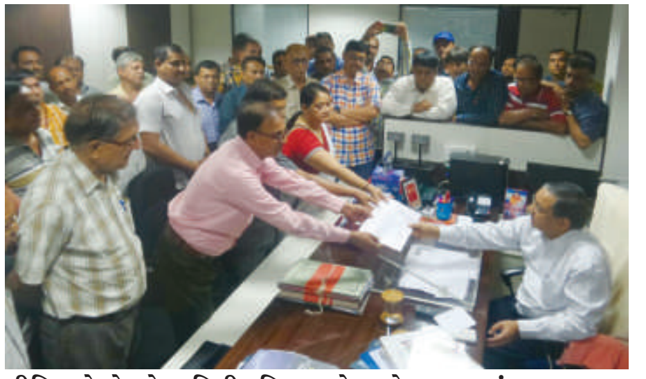
મીડિયા ફેડરેશને માહિતી કમિશનરને આવેદન પાઠવ્યું મીડિયા ફેડરેશન ગાંધીનગર દ્વારા આજે માહિતી કમિશનરને જાહેરબનના દર બાબતે આવેદન પત્ર પાઠવવામાં આવ્યું હતું. માહિતી કમિશનર એસ.બી. રાવલને રજૂઆત કરવામાં આવી હતી કે ગુજરાતના તત્કાલીન મુખ્યમંત્રી અને હાલના વડાપ્રધાન નરેન્દ્રભાઈ મોદીના વિજીનને માન આપીને તેમના કાર્યકાળ દરમિયાન ઘડાયેલ નીતિ અન્યથે નવા દર કરાર કરવામાં આવે તેવી અખબારોના પ્રકાશકો, મુદ્રકો અને તંત્રીઓએ માંગ કરી હતી.

તે જ કલાકમાં બીજી એક ગાડી નં. જીજે-૧૮-બી.એ. ૫૬ ૭૬નો પણ કાય ફોડ્યો હતો. દહેગામના વખતસિંહ અમરસિંહ ચૌહાણની આ ગાડીના કાય ફોડી અંદરથી કોઈ મોટી રકમ ન મળતા દસ્તાવેજોની ઉઠાંતરી કરી ચોરો ફરાર થઈ ગયા હતા. આ મામલે સે. ૨૧ પોલીસે ગુનો નોંધી પીએસઆઈ બી.કે. અસારીએ ઝીણવટભરી તપાસ શરૂ કરી છે.