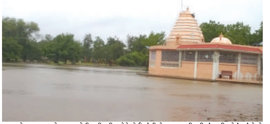
ધોધમાર વરસાદે નગરજનોની બધી ફરીયાદોને ધોઈ નાંખી છે. સાબરમતી નદીમાં પાણી વહેતું થયું છે તો ભારે વરસાથી શહેરમાં ઠંડ ઠંડ પાણી ભરાયા છે. સેક્ટર-૪ના ઓમકરેશ્વર મંદિર પાસેના મેદાનમાં પાણી ભરાતા જણે નાનકડા સરોવરનું નિર્માણ થયું છે.

ગૃહિણીઓએ રાહતનો શ્વાસ લીધો હતો. ભેજચુકત કપડાંઓને ગૃહિણીઓએ ઉઘાડમાં સુકવ્યા હતા. વરસાદ બંધ થતા વસાહતીઓ સાબરમતીમાં આવેલા પાણી અને સેક્ટર-૧નું તળાવ ખોવા ઉભટ્યા હતા.