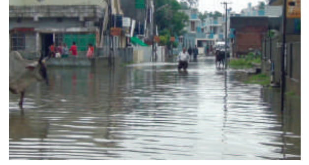
પાણી ખેંચી વિદ્યાકુંજનો પ્રશ્ન હલ