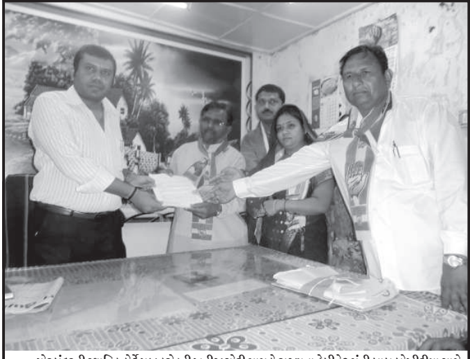
પોરબંદરની સ્થાનિક કોર્ટે પૃથ્વી કોસ્ટની ખનીજ ચોરી મામલે રાજ્યના કેબીનેટ મંત્રી બાબુ બોપીરીયા સામે આરોપ સાબિત માનીને જૂદી જૂદી કલમો હેઠળ ૩ વર્ષની જેલની સજા ફટકારી છે. આથી મંત્રી બાબુભાઈ મંત્રી પટેલની રાજીનામું આપે તેવી માંગણી સાથે આજે દહેગામ કોર્ટેસ દ્વારા એસ.ટી. ચોક ખાતે ઉચ્ચ વિરોધ સાથે સુબોધ્યાર કરી દહેગામ મામલતદારને આવેદનપત્ર આપ્યું હતું અને મુખ્યમંત્રી ત્વરિત કાર્યવાહી કરે તેવી ઉચ્ચ માંગણી કરી રહ્યા છે.