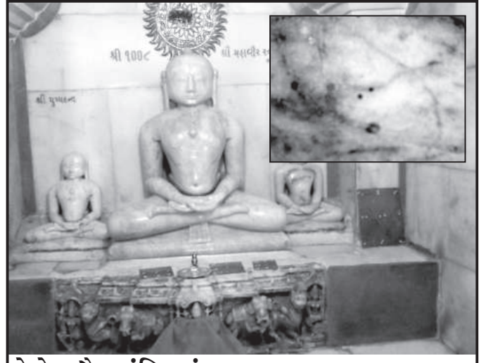
દેરોલ જૈન મંદિરમાં યમત્કાર