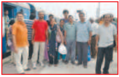
પહોંચી ગયા હતા. જીવન-મરણ વચ્ચે યાત્રાળુઓના માનસપટ પર જોલા પાતાના આ યાત્રાળુઓએ પળ-તબાહીના દર્શ્યો કદાચ આજીવન પળે જીવનુમાવતી માનવજીવનો ડીલીટ નહીં થાય. કુદરતી આક્રમણ