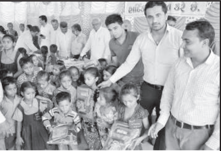
પાલનપુર શાળા નં. ૧ માં શાળા પ્રવેશોત્સવ યોજાયો