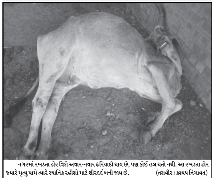
નગરમાં રખડતા ઢોર વિશે અવાર-નવાર ફરિયાદો થાય છે, પણ કોઈ હલ થતો નથી. આ રખડતા ઢોર જ્યારે મૃત્યુ પામે ત્યારે સ્થાનિક રહીશો માટે શીરદર્દ બની જાય છે.