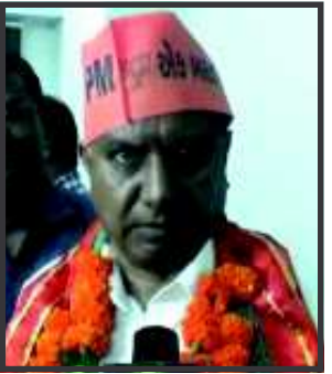
ઝો. કે. સી. પટેલ-વલસાડ

વિધાનસભાની સાત બેઠકોની પેટા ચૂંટણીમાં કોંગ્રેસની ૩ બેઠકો પર જીત કોંગ્રેસના રાષ્ટ્રીય પ્રવક્તા અને વિધાનસભા વિરોધપક્ષના પૂર્વ નેતા શક્તિસિંહ અબડાસાની બેઠકથી ચૂંટણી જીત્યા અમદાવાદ, તા. ૧૬ ગુજરાતમાં લોકસભાની ૨૬ બેઠકો સાથે વિધાનસભાની સાત બેઠકોની પેટા ચૂંટણીમાં આજે જાહેર થયેલા પરીણામોમાં કોંગ્રેસને ચાર અને ભાજપનો ત્રણ બેઠકો પર વિજય થયો છે. વિજય થયેલા ઉમેદવારોમાં વિધાનસભા વિરોધપક્ષના ભૂતપૂર્વ નેતા અને કોંગ્રેસના રાષ્ટ્રીય પ્રવક્તા શક્તિસિંહ ગોહિલ કચ્છ અબડાસાની બેઠક પરથી ચૂંટણી જીત્યા છે. આ ઉપરાંત