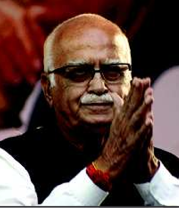
લાલકૃષ્ણ અડવાણી- ગાંધીનગર