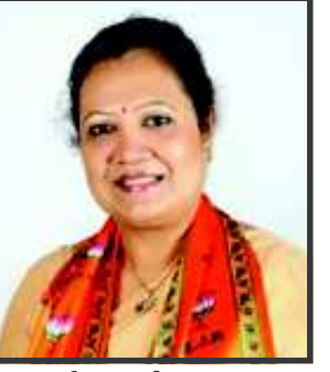
દર્શના જરદોશ - સુરત