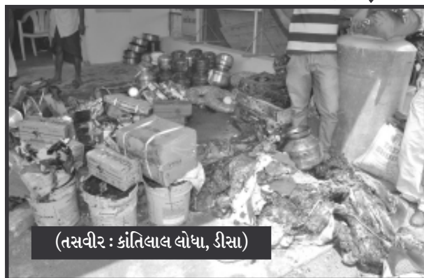
સંકળાયેલી હોઈ ડેઈલી સર્વિસમાં મોટા શહેરોમાંથી ટ્રુકો મારફતે વહેપારીઓનો માલસામાન અહીં લવાય છે અને ગોડાઉનમાંથી જે તે

આ ઘટનાની મળતી વિગતો જોઈએ તો બનાસકાંઠાનાં ડીસાનાં લાટીબજાર વિસ્તાર માં આવેલી ડાયમંડ ટ્રાન્સપોર્ટ કંપનીની ગોડાઉનમાં શોર્ટ શર્કિટની ઘટના -કાશમાં આવેલી છે, શહેરમાં જાણીતી ડાયમંડ ટ્રાન્સપોર્ટ કંપની મુંબઈ, સુરત, વડોદરા, અમદાવાદ, જેવા મોટા શહેરો સાથે ટ્રાન્સપોર્ટ વ્યવસાયે