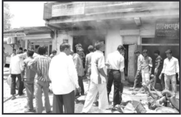
ઘટનામાં ગોડાઉનમાં પડેલા પુસ્તિ કરેલ છે.

અંદાજીત એક કરોડથી વધુનાં માલસામાનનાં નુકશાનની આ ગોડાઉનના ટીપક ઠક્કર મેનેજરે