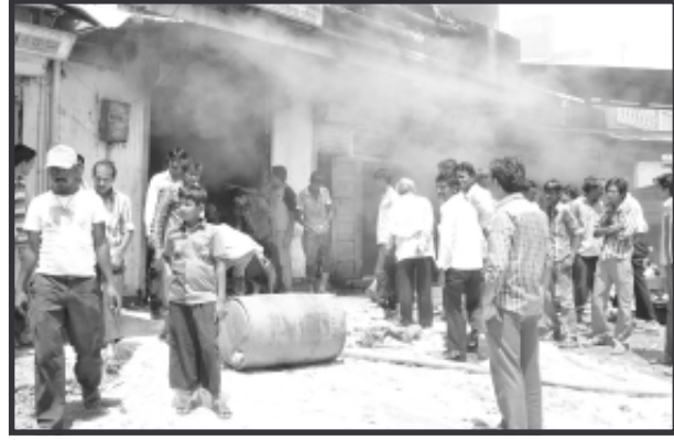
ટ્રાન્સપોર્ટ કંપની માં બપોરના જહેમતે આગ પર કાબુ મેળવ્યો

ડીસા, તા. ૧૯ ડીસા નાં લાટી બજાર વિસ્તાર માં આવેલી એક ખાનગી