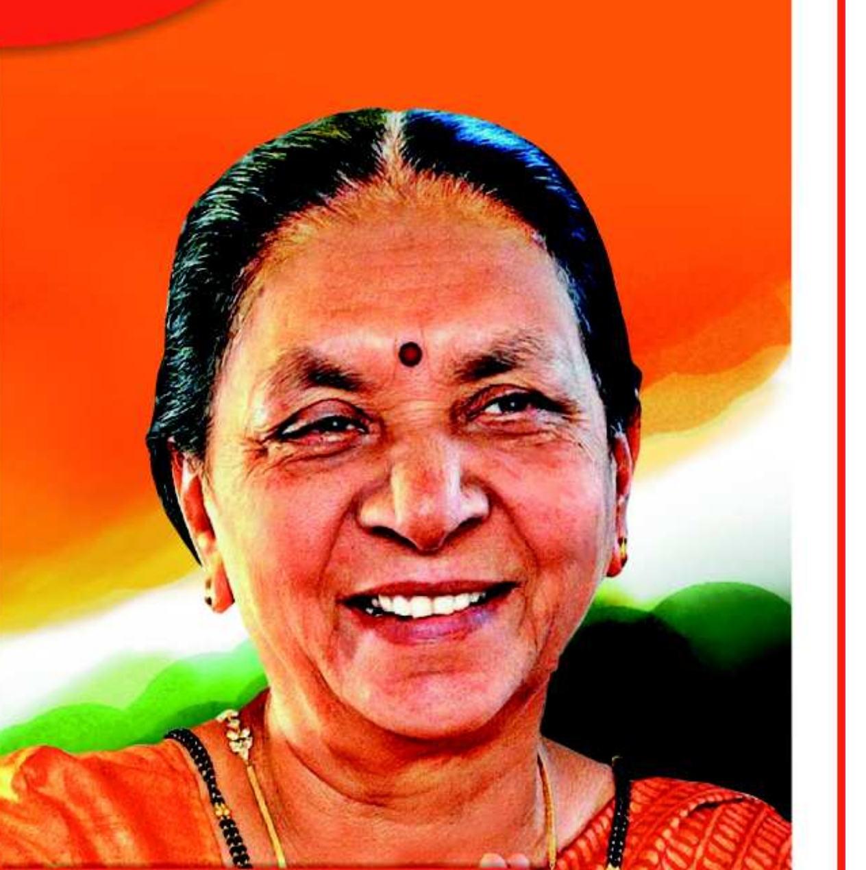
આદરણીય શ્રીમતી આનંદીબેન પટેલ ગુજરાતના પદનામિત મુખ્યમંત્રીને...

સાંસ્કૃતિક પાટનગરના નાગરિકોની લાખ લાખ શુભકામનાઓ... ગાંધીનગર કલ્ચરલ ફોરમ