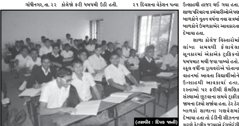
ગાંધીનગર, તા. ૨૨ કોલેજો ફરી ધમધમી ઉઠી હતી. ૨૧ દિવસના વેકેશન પત્યા ઉત્સાહથી હાજર થઈ ગયા હતા. શાળા પરિવારના કર્મચારીઓએ પણ બાળકોને નૂતન વર્ષના નવા સત્રમાં બાળકોને ઉમળકાભરે આવકારતા દેખાયા હતા. શાળા કોલેજ વિસ્તારોમાં લાંબા સમયથી ફેલાયેલા સૂનકારમાં એકાએક ટ્રાકિકનો ધમધમાટ મચી જવા પામ્યો હતો. સ્કૂલ વર્ધીના ડ્રાઇવરોએ પોતાના વાહનમાં આવતા વિદ્યાર્થીઓને ઉત્સાહથી આવકાર્યા હતા. રસ્તાઓ પર ફરીથી શૈક્ષણિક સંસ્થાઓ છુટવાના સમયે ટ્રાફિક જામના દેશ્યો સર્જાયા હતા. ઠેર ઠેર બાળકો શાળાના ગણવેશમાં દેખાયા હતા તો ઠીકની સીડનના કારણે કેટલીક જગ્યાએ રંગભેરંગી સ્વેટર અને ટોપીમાં ભૂલકાઓ શાળાએ જતા નજરે ચઢતા હતા.