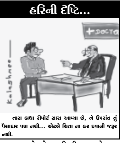
તારા બધા રીપોર્ટ સારા આવ્યા છે, એ ઉપરાંત તું પેસાદાર પણ નથી... એટલે ચિંતા ના કર દવાની જરૂર નથી.