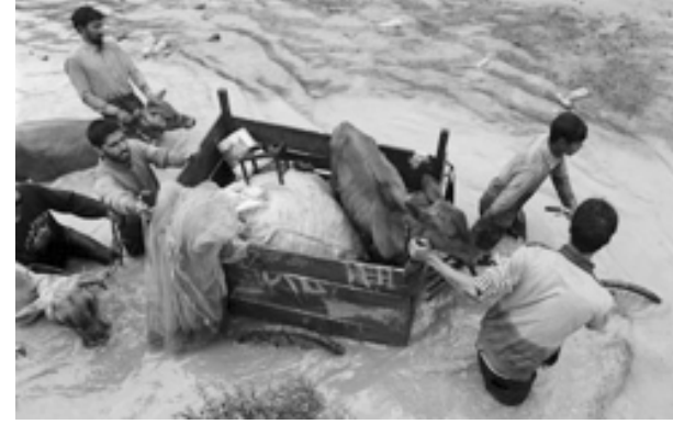
જેલમ નદીમાં પાણીની સપાટી ભયજનક સ્તરથી પણ ચાર ફુટ ઉપર પહોંચી જતા ગઈકાલે જ શ્રીનગર શહેરમાં પુર એલર્ટની જાહેરાત કરવામાં આવી હતી. દક્ષિણ કાશ્મીરના અનંતનાજ

છે. બચાવ અને રાહત કામગીરી યુદ્ધના ધોરણે ચાલી રહી છે. જનજીવન સંપૂર્ણપમે ખોરવાઈ ગયું જિલ્લા અને કુલગામ ખાતે પુરના લીધે ૨૩ ગામો પુરના સંક્રમણમાં આવી ગયા છે. છેલ્લા પાંચ દિવસથી ભારે વરસાદ પડી રહ્યો છે. જેથી દક્ષિણ કાશ્મીરના અનંતનાજ અને કુલગામ જિલ્લામાં સૌથી વધારે કફોડી હાલત થઈ છે. શ્રીનગર શહેરમાં પણ પુર એલર્ટની જાહેરાત કરવામાં આવી દક્ષિણ કાશ્મીરના અનંતનાજ