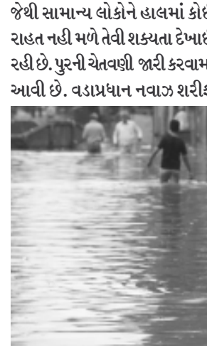
સામે છેલ્લા ત્રણ સપ્તાહની વિરોધી પાર્ટીઓ જોરદાર પ્રદર્શન કરી રહી છે. આવી સ્થિતિમાં કુદરીત હોનારતાના લીધે હાલત કફોડી બની છે. નેશનલ ડિઝાસ્ટર મેનેજમેન્ટ ઓથોરિટી ચેરમેન મેજર જનરલ મોહમ્મદ સર્હદ પુરના કારણે ઉભી થયેલી સ્થિતિ અંગે તમામને માહિતી આપી છે.

જેથી સામાન્ય લોકોને હાલમાં કોઈ રાહત નહી મળે તેવી શક્યતા દેખાઈ રહી છે. પુરની ચેતવણી જાહેર કરવામાં આવી છે. વડાપ્રધાન નવાઝ શરીફ વડાપ્રધાનને પણ આ અંગે માહિતી આપવામાં આવી છે. પંજાબ, પોક તે ગિલગિટ-બાલ્ટિસ્તાનમાં સૌથી વધારે પુરની