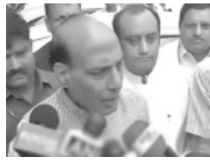
શ્રીનગર, તા. ૬ જમ્મુ કાશ્મીરમાં વિનાશક પુરની સ્થિતિની સમીક્ષા કર્યા બાદ કેન્દ્રીય ગૃહપ્રધાન રાજનાથસિંહે ખાતરી આપી હતી કે, જમ્મુ કાશ્મીર સરકારને પુરની તમામ મદદ કરવામાં આવશે.

૨૫૦૦થી વધુ ગામોને ભારે અસર : રાજનાથનો મત શ્રીનગર, તા. ૬ જમ્મુ કાશ્મીરમાં વિનાશક પુરની સ્થિતિની સમીક્ષા કર્યા બાદ કેન્દ્રીય ગૃહપ્રધાન રાજનાથસિંહે ખાતરી આપી હતી કે, જમ્મુ કાશ્મીર સરકારને પુરની તમામ મદદ કરવામાં આવશે. જમ્મુ કાશ્મીરમાં ૬૦ વર્ષના લાંબાગાળા બાદ આ પ્રકારની સ્થિતિ સર્જાઈ છે. તેમણે કહ્યું હતું કે, ૨૫૦૦ ગામોને સૌથી માઠી અસર થઈ છે જે પૈકી ૪૫૦ લોકોને સંપૂર્ણપણે ડુબી ગયા છે. ગૃહપ્રધાન પરિસ્થિતિની સમીક્ષા કરવા એક દિવસની મુલાકાતે રાજ્યમાં આવી પહોંચ્યા હતા. રાજનાથસિંહે કહ્યું હતું કે, તેઓ મુખ્યમંત્રી ઓમર અબ્દુલ્લા અને વરિષ્ઠ અધિકારીઓને મળીને પરિસ્થિતિની સમીક્ષા કરી ચુક્યા છે. તેમણે એમ પણ કહ્યું હતું કે, અતિ ખરાબ હવામાનના લીધે તેઓ હવાઈ નિરીક્ષણ કરી શક્યા નથી. રાજનાથસિંહે જમ્મુ કાશ્મીરના લોકો અને સરકારને ખાતરી આપી હતી કે, કેન્દ્ર સરકાર કટોકટીના સમયમાં તેમની સાથે છે. બનતી તમામ મદદ કરવામાં આવશે. જો શહેરમાં આટલું નુકસાન છે તો ગ્રામીણ વિસ્તારોમાં હાલત કેવી કલ્પના કરી શકાય છે. ગૃહમંત્રીની સાથે રાજ્યના અંગન, જાહેર ફરિયાદ નિવારણ અને પેન્શન પ્રધાન પણ રહ્યા હતા. સૌથી પહેલા લોકોને બચાવવાની જવાબદારી રહેલી છે. શાકભાજી, ફળફળાદી, ડાંગર, મકાઈના પાકને ભારે નુકસાન થયું છે. ૩૮૦ ગામો સંપૂર્ણપણે નાશ પામ્યા છે. રેવન્યુ અને રાહત સચિવ વિનોદ પોલે અગાઉ કહ્યું હતું કે, ૩૮૦ ગામો ખીણમાં ડુબી ગયા છે જ્યારે ૧૨૨૫ ગામો આશંકિતિને અસર પામ્યા છે. એકલા જમ્મુમાં ૧૦૦૦ ગામોમાં પુરના કારણે અસર થઈ છે.