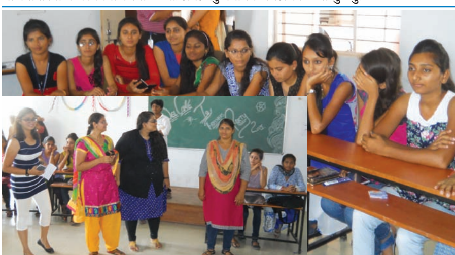
ચોધરી મહિલા કોમર્સ કોલેજ ખાતે પ્રથમ વર્ષની વિદ્યાર્થીનીઓ દ્વારા ફેશન પાર્ટીનું આયોજન કરવામાં આવ્યું હતું, જે અંતર્ગત આનંદપ્રદ રમતોનું વિદ્યાર્થીનીઓએ આયોજન કર્યું હતું.