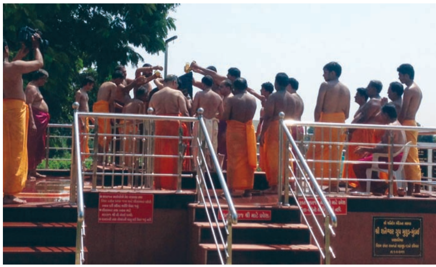
આજે શ્રાવણની અમાસ એટલે શનિ અમાવસનો અનોખો સંયોગ હોવાથી તેનું શનેશ્વરી અમાસ તરીકે અને રૂ માહત્વ્ય છે. ન્યાયના દેવતા ગણાતા શનિદેવના ભક્તો આજે શનિ અમાવસના જુજ સંયોગ આવતા ભગવાન શનિહારાજના આશીર્વાદ મેળવવા શ્રી વારીનાથ હનુમાનજી પંચદેવમ એવમ શ્રી શનિદેવ મંદિર લીંબોઈમાં અરવલ્લી જિલ્લાના અને આજુબાજુના ગામડાના ભક્તજનો ઉમટી પડ્યા હતા. અરવલ્લી જિલ્લાના મોડાસા તાલુકાના લીંબોઈ ગામમાં આવેલ શ્રી વારીનાથ હનુમાનજી પંચદેવમ એવમ શ્રી શનિદેવ મંદિર લીંબોઈના પટોગણમાં જુજસંયોગમાં આવતી શનિ અમાવસના દિવસે શ્રી શનિદેવ મહારાજનો અભિષેક પદ ભોગ પ્રસાદ તેમજ સંધ્યા આરતીનું ભવ્ય આયોજન કરવામાં આવ્યું હતું.