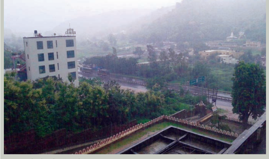
જિલ્લાના ખેડૂતો અને ભુમિપૂત્રો વિનવણી કરી રહ્યા છે. ઝરમર વરસાદથી મોડાસા શહેરના માર્ગો અને સોસાયટી વિસ્તારોમાં પાણીના ખાબોચીયા ભરાઈ રહેતા રોગચાળો ફાટી નિકળવાની આશંકાએ પ્રજાજનો દ્વારા ખાબોચીયા ભરાયેલી જગ્યાએ અને સોસાયટી વિસ્તારમાં નગરપાલિકા દ્વારા દવાનો છંટકાવ કરવામાં આવે તેવી માંગ ઉઠી છે.

મોડાસા, તા. ૨૧ અરવલ્લી જિલ્લામાં ચાર દિવસથી વરસાદી આંશિક ફાયદાગ્રપ છે. જિલ્લામાં ધીમે ધીમે પડી રહેલા વરસાદના લીધે જિલ્લાના ગામડાઓમાં અને નીચાણવાળા વિસ્તારોમાં ઠેર ઠેર કાદવ-કચડાનો ઉપદ્રવ થતાં લોકો મચ્છરોના ત્રાસથી બિમારીમાં સપડાઈ રહ્યા છે. જિલ્લામાં રવિવાર અને સોમવારે