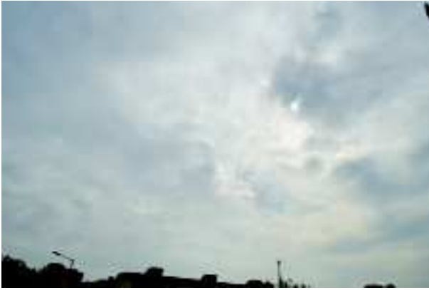
ઘઉંની કાપણીની સીઝન ચાલી રહી છે ત્યારે રાજ્યના કેટલાક વિસ્તારોમાં વરસાદ અને ઝાકળવર્ષા થતા ખેડૂતો

ગાંધીનગર, તા. ૧૩ ભારતમાં વાતાવરણ પલ્ટાયું છે. એપ્રિલ મહિનામાં આકરી ગરમી પડવી જોઈએ તેના સ્થાને વાતાવરણ ઠંડું બની રહ્યું છે. પાટણ સહિત ઉત્તર ગુજરાતના કેટલાક સ્થળોએ ગઈકાલે કરા પડ્યા હતા. ગાંધીનગરમાં તેની અસર સ્વરૂપે ઠંડો પવન ફૂંકાવવો શરૂ થયો હતો અને વાઘોની અવરજવર શરૂ થઈ હતી. ધૂપ-છાંવ જેવું વાતાવરણ સર્જતા મહત્તમ તાપમાન જે એક સમયે ૪૧ ડિગ્રીથી વધુ પહોંચી ગયું હતું તેને એક ઝટકે ૨ થી ૩ ડિગ્રી જેટલું નીચું ઉતરી ગયું હતું. આજે મહત્તમ તાપમાન ૩૮ ડિગ્રી જેટલું રહેતા ગરમીથી રાહત મળી હતી. ગાંધીનગરમાં જાણે ચૈત્ર મહિનામાં અપાઠી માહોલ છવાયો હોય તેવું લાગતું હતું. સૌરાષ્ટ્રના રાજકોટ અને તેની આસપાસના વિસ્તારોમાં વરસાદ પડ્યો હોવાના સમાચાર પ્રાપ્ત થયા હતા. હાલમાં