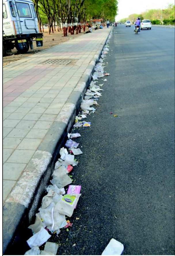
સ્વયં શિસ્ત કે ફરજિયાતપણે કરાવવામાં આવતી કોઈ કતાર માટે આ તસવીર લેવામાં આવી છે એવું જો તમે માનતા હોવ તો એ તમારી ભૂલ છે. હકીકતે નગરજનોની, મુસાફરોની ને સફાઈ કર્મચારીઓની અશિસ્તનો આ નમૂનો છે, જેના પ્રતાપે પ્રતિબંધિત કોથળીઓ જેવો કચરો સ્વયં શિસ્તપૂર્વક ધ માર્ગના કોરાણે ગોઠવાઈ ગયો છે. અને આ સૌના પ્રતાપે આ સુંદર તસવીર સાંપડી છે.

આજે મળનારી આ બેઠકમાં સરકારે પાણી અને ગટરની કામગીરી સોંપવા માટે બતાવેલી તૈયારીને લઈ મહત્વનો નિર્ણય લેવામાં આવનાર છે. કોંગ્રેસ પક્ષ સત્તા સોંપણી માટે વારંવાર રજૂઆત કરતો આવ્યો હોવાથી સરકારે કમશ: સત્તા સોંપણીની તૈયારી દર્શાવી છે અને પ્રથમ તબક્કામાં પાણી અને ગટરની ● અનુસંધાન પાલ-૫ પર