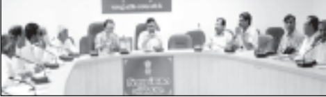
૦૪/૧૧ના રોજ જિલ્લા પંચાયત, ગાંધીનગર ખાતે મળી હતી. આ બેઠકમાં જિલ્લાના ચાર તાલુકાના અલગ અલગ તાલુકા વીમની રૂપરેખા નક્કી કરવામાં આવી હતી. કૃષિ મહોત્સવની સાથે સાથે સરકારી સહાય યોજનાઓ, એડીવીટી, જનસેવા કેન્દ્રોની સમજ આપવાનું એક આયોજન કરવામાં આવ્યું છે. મતદારોમાં મતદાન અંગેની જાગૃતિ માટે માહિતી-માહિતી આપતી પેનલ પણ કાર્યક્રમમાં જમીન સંરક્ષણ અને સુધારણા, ડાંગર, દિવેલા, કપાસ, ઠિકવેલા, ઘઉં પાકની ઉત્પાદકતા વધારવાનો રહેશે. કલાલ તાલુકામાં જમીન સંરક્ષણ અને સુધારણા, ડાંગર, દિવેલા, કપાસ, ઘઉં પાકની ઉત્પાદકતા વધારવી અને બાગાયત પાકોની ઉત્પાદક વધારવી અને ગાંધીનગર તાલુકામાં હાઈટેક એગ્રીકલ્ચર/ હોટીટીકલ્ચર, ખેતીની જમીન બચાવો-ભિન ખેતી અટકાવો,

ગાંધીનગર, તા. ૧૯ મહોત્સવ-૨૦૧૨ ના.૬ મે-૨૦૧૨ થી શરૂ થશે. ૩૦ દિવસ સુધી સમગ્ર જિલ્લામાં યોજા-થરા કૃષિ મહોત્સવના સુચારું આયોજન માટે જિલ્લા અમલીકરણ સમિતિને બેઠક જિલ્લા કલેક્ટર શ્રી પી.સ્વરૂપના અધ્યક્ષ સ્થાને અને જિલ્લા વિકાસ અધિકારી એમ. એ. ગંધીની ઉપસ્થિતિમાં ૧૮ કાંચકમ પણ યોજાશે. જેમાં જિલ્લાની તાલુકા કલેક્ટરવાઈઝ બેઠકના ગામમાંથી ત્યાં કૃષિ મહોત્સવનો કાર્યક્રમ યોજવામાં આવશે. કૃષિ મહોત્સવ અંતર્ગત સવારના ૮.૩૦ કલાકથી રાત્રિના ૯.૦૦ કલાક સુધી યોજાનારા કાર્યક્રમનો સમાવવાર