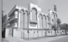
સેક્ટર-માં ધાર્મિક, શૈક્ષણિક સ્વયંભૂ સગવડો ઉપસ્થિત થયેલ છે. સેક્ટર-૫ એ માં મેરલા વિદ્યાલય આવેલી છે. જેમાં માધ્યમિક શિક્ષણ આપવામાં આવે છે. જેની નાજીક નિલકૃષ્ણ મહાદેવનું મંદિર વગણલીઓએ ઈલુગ કરેલ છે. આ ઉપરાંત શૌચાલયોનું પણ મંદિર આવેલું છે.