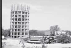
એ, બી, સી, ડી માં વર્કશી કરેલ છે. આ ચાર વિભાગમાં અંદાજે ૩૦૦૦ મકાનો આવેલા છે.

સેક્ટર-૫ ૧ કિ.મી. x ૧ કિ.મી. ઉપવર્ણી ધામલુધમી ઘાઘ છે. કોમીએકતા વિસ્તારમાં આવેલું છે. જેમાં ચાર વિભાગમાં અનુરૂપ એક મંડિર પણ આવેલ છે.