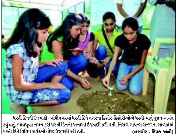
ધરતી દિનની ઉજવણી - ગાંધીનગરમાં ધરતી દિન નગરના કિશોર-કિશોરીઓએ ધરતી-માનું પૂજન-અર્ચન કર્યું હતું. ભાવપૂર્વક નમન કરી ધરતી દિનની અનોખી ઉજવણી કરી હતી. નિર્સર્ગ સાયન્સ સેન્ટરના બાળકોએ ધરતી દિને વિવિધ કાર્યક્રમો યોજા ઉજવણી કરી હતી.