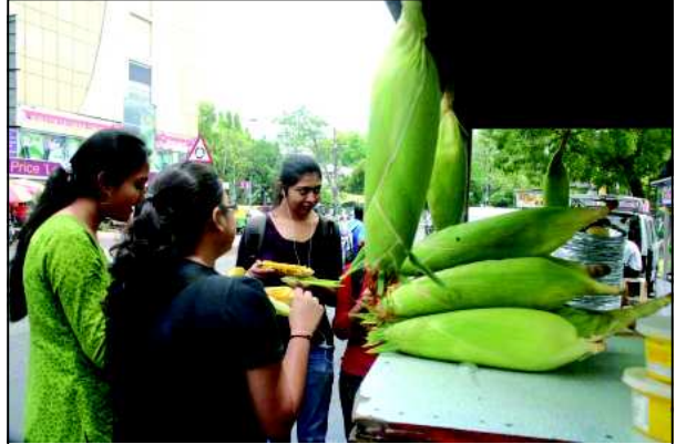
મકાઈની મજા - આજકાલ વાતાવરણમાં ફેરફાર જોવા મળે છે, ક્યારેક તાપ તો ક્યારેક વાદળાણું વાતાવરણ રહે છે... સોમવારે વાદળાણા વાતાવરણનો અહેસાસ નગરજનોએ કર્યો. થોડા દિવસો પહેલા વાતાવરણ પલ્ટાયું અને વરસાદી ઝાપટાની મજા શહેરીજનોએ માણી... વરસાદી ઝાપટાની સાથે સાથે અમેરીકન મકાઈનું બજાર પણ જામી રહ્યું છે... અને આજે વાદળાણા વાતાવરણમાં મકાઈની મજા માણતી યુવતીઓ...

સાથે હાથ ધરનાર કામો સંદર્ભે હવે આગામી ૩ મે ના રોજ સે. ૧૭ ટાઉનહોલ ખાતે લોકાર્પણવિધિનો કાર્યક્રમ યોજવામાં આવશે. આ દરમિયાન મુખ્યમંત્રી નરેન્દ્ર મોદીના હસ્તે ગુડા વિસ્તારના વિકાસને અનુલભી ૧૨૫ કરોડના વિવિધ કામોનું લોકાર્પણ કરવામાં આવશે.