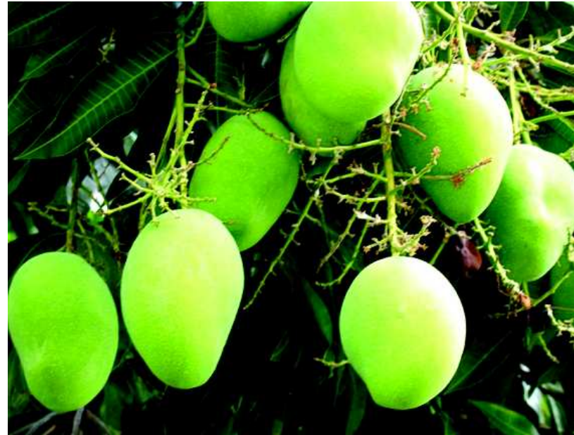
આમ તો કેરીની ઋતુ આવી પહોંચી છે, પણ હજુ જોઈએ એવી પાકી કેરી જોવા મળતી નથી. ગ્લોબલ વોર્મીંગ કહો કે વેસ્ટર્ન ડિસ્ટર્બન્સ પણ આ વખતે ગરમીય મોડી પડી છે અને કેરીય મોડી થઈ છે. એમાંય વળી વચ્ચે માવડું આવી જતાં કેરીને નુકસાન થયાની ભૂમો પણ સંભળાઈ રહી છે. બજારમાં હવે માંડ માંડ મોટી સાઈઝની કાચી કેરી જોવા મળી રહી છે. અલબત્ત, કાચી કેરીના શોખીનો તો આ કેરી જોઈને આનંદમાં આવી ગયા છે અને એની મજા પણ લેવા માંડ્યા છે, પરંતુ પાકી કેરીના ચાહકોએ હજુ વીસેક ટિવસ રાહ જોવી પડશે.

વહીવટમાં સરળીકરણની સાથે સાથે પ્રશ્નોના ઝડપી ઉકેલ માટે સરકારે નાગરિક અધિકાર પત્ર અમલમાં મુક્યા બાદ હવે આપણો તાલુકો વાયબ્રન્ટ તાલુકાનો અભિગમ અપનાવ્યો છે. તેમાં હજુ અંતરાયો આવી રહ્યા છે પણ અમે તેના અમલીકરણ માટે ક્રિટિકલ છીએ અને અમલમાં લાવીને જ ઝંપીશું. આજે ગાંધીનગર ખાતે સ્ટેમ્પ ડ્યુટી ભવન તેમજ જિલ્લાકક્ષાની કચેરીઓના નવા મકાનના ખાતમુહૂર્ત વિધિ બાદ સંબોધતાં શ્રીમતિ પટેલે જણાવ્યું હતું કે પ્રજાના પ્રશ્નો ઘણા વર્ષોથી પડતર પડ્યા છે. આ પ્રશ્નો માટે જે ધ્યાને તંત્રએ આપવું જોઈએ તે આપ્યું નથી અને એથી જ અમે આ દિશામાં આગળ વધી રહ્યા છીએ. તેમણે જણાવ્યું હતું કે જિલ્લાઓમાં પ્રશ્નો ફાઈલોમાં અટવાયેલા ના રહે તે માટે ટ્રેકીંગ પદ્ધતિ દાખલ કરવાની વિચારણા ચાલી રહી છે. તેમણે કહ્યું કે આ અંગેના પાયલોટ પ્રોજેક્ટનું અમલીકરણ મહેસાણા જિલ્લામાં કરાયા બાદ અહંવાલ તૈયાર થઈ ગયો છે અને હાલ તેના પર અભ્યાસ ચાલી રહ્યો છે. અને ટૂંક જ સમયમાં તેનું અમલીકરણ કરવામાં આવશે તેવો નિર્દેશ પણ આપ્યો હતો. આ ટ્રેકીંગ પદ્ધતિના અમલને