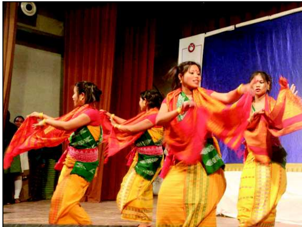
સ્કૂલ-કોલેજમાં વેકેશનના માહોલને કારણે સાંસ્કૃતિક પ્રવૃત્તિઓની માંસમ પૂરબહારમાં ખીલી છે. વિવિધ સાંસ્કૃતિક પ્રવૃત્તિઓથી હોલ પેક જાય છે. આવો જ એક સાંસ્કૃતિક કાર્યક્રમ અમદાવાદ ખાતે યોજાયો હતો, જેમાં દેશના વિવિધ પ્રાંતોનાં લોકનૃત્યો રજૂ થયાં હતાં.