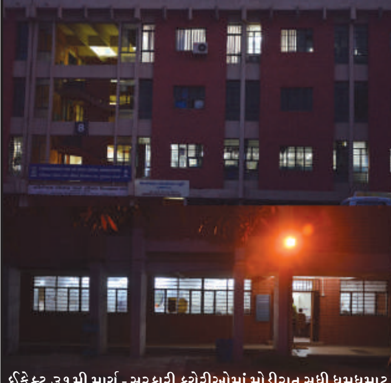
ઈફેક્ટ ૩૧ માર્ચ - સરકારી કચેરીઓમાં મોડીરાત સુધી ધમધમાટ