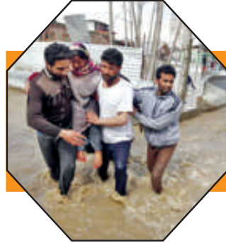
જમ્મુ કાશ્મીરમાં પુરની સ્થિતિ હજુ વિકટ Page-6