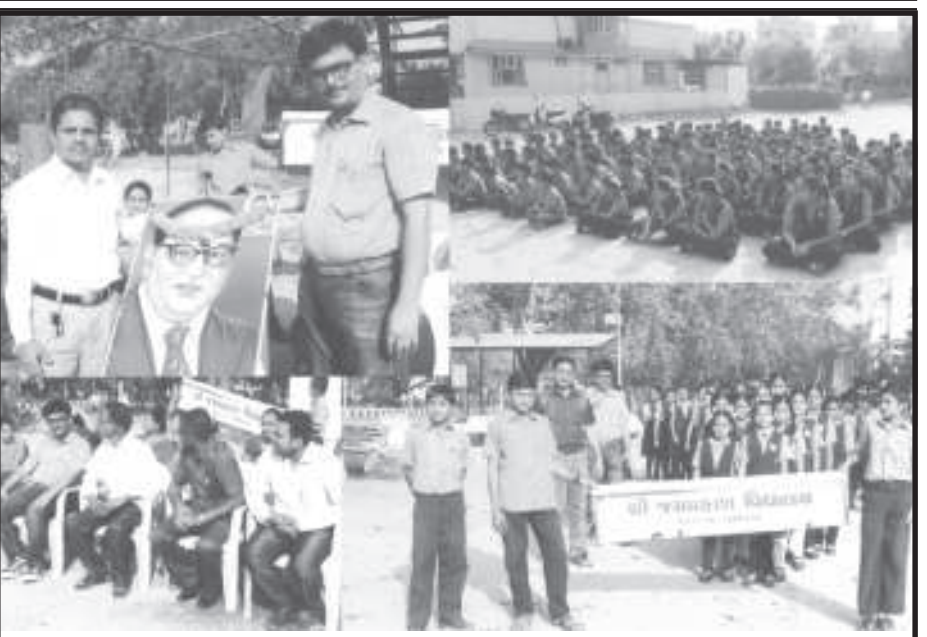
ભારત રત્ન ડૉ. બાબા સાહેબ આંબેડકરની જન્મ જયંતિની જય પ્રકાશ વિદ્યાલય દ્વારા ઉજવણી કરવામાં આવી હતી. શાળાના પટંગણમાં આ નિમિત્તે આચાર્ય દ્વારા બાબા સાહેબના જીવન કવન ઉપર રસપ્રદ માહિતી આપવામાં આવી હતી. આ પ્રસંગે શાળા સંચાલક મંડળના હોદ્દેદારો, શિક્ષકો અને મોટી સંખ્યામાં વિદ્યાર્થીઓ ઉપસ્થિત રહ્યા હતાં.