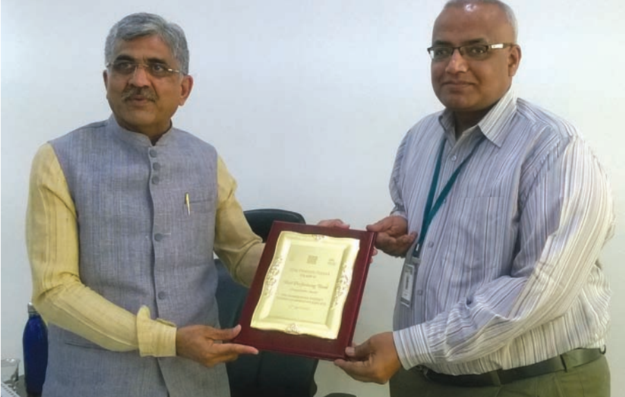
સાબરકાંઠા બેંક બેસ્ટ પરફોર્મીંગ બેંક ઈન અટલ પેન્શન યોજના એવોર્ડથી સન્માનિત