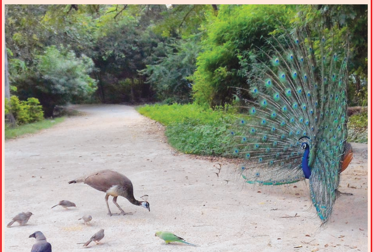
કળાનું મહત્વ અને મહાત્મ્ય બન્ને વિશેષ છે. વ્યક્તિમાં પણ કંઈ વિશેષ હોય તો તે કળા છે. મોરની કળા તો શિરમોર છે. કળા કરીને તે ઢેલને પોતાના પ્રતિ આકર્ષિત કરવાનો પ્રયત્ન કરે છે. આજકાલ મોરની કળા કરવાની મોસમ પૂરબહારમાં છે... આ દિવસોમાં તે પોતાની સંગિની શોધીને સંસાર માંડવાની શરૂઆત કરે છે. માણસનું મન પણ બહુ મજામાં હોય તો તે મોર બનીને થનગનાટ કરે છે, એમ કહેવાય છે. જોકે કોઈ વ્યક્તિ અન્યને મુર્ખ બનાવી જાય તો તેના માટે પણ 'કળા કરી ગયો' એવો રૂઢિપ્રયોગ થાય છે...! ગાંધીનગરમાં મોર ઘણા છે... (અહીં માત્ર પંખીનો જ ઉલ્લેખ છે હો...!) ગાંધીનગરની વનરાજીમાં વહેલી સવારે કળા કરતા મોરને માણવાનું રહી ન જાય...