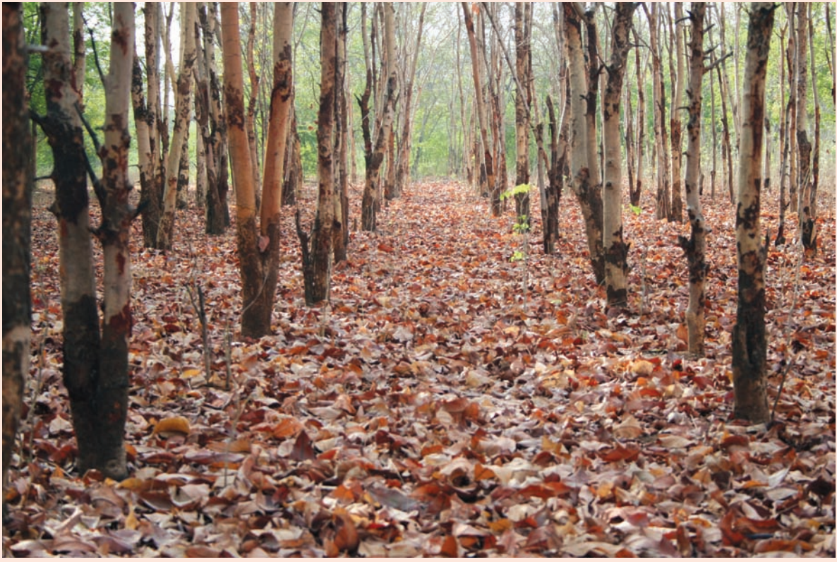
પાનખરનું પણ એક આગવું સૌંદર્ય હોય છે. ડાળીઓ પરથી ખરી પડેલા પર્ણોની ભિગાટ સુકા વનોનો વૈભવ છે. ગાંધીનગરમાં વૃક્ષો ઘણા એટલે પાનખરનો વૈભવ પણ ઘણો. કેલેન્ડરમાં તો આ અઢવાડિયે ગૌમ્મ ઋતુ બેસી ગઈ છે. બે-ચાર દિવસમાં આપણા અહેસાસમાં પણ આવી જશે. પાનખરનો વૈભવ માણવાની આ છેલ્લી તક છે... ગાંધીનગરમાં વિધાનસભાની પાછળના વનમાં પાનખરનું સૌંદર્ય સોળે કળાએ છે...