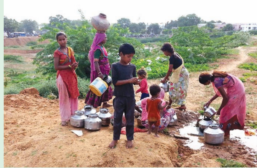
૪૦ ડિગ્રી ગરમીથી પ્રજાજનો પરસેવાથી રેબઝેબ બન્યા છે. જળાશયો, કુવાના તળીયા દેખાયા અમુક ગ્રામ્ય વિસ્તારોમાં પીવાના

તાલુકામાં મીનરલ પાણીના નામ ઉપર બે નંબરનો ષિકતો ધંધો બે નંબરીયા વેપારીઓ કરી રહ્યા છે સાથે-સાથે પ્રજાજનોના આરોગ્ય સાથે ચેડા થઈ રહ્યા છે પરંતુ વહીવટી તંત્ર આંખ આડા કાન કરે છે. આધારભુત સુત્રો ધ્વારા પ્રાપ્ત માહિતી મુજબ આ વર્ષે જો ચોમાસુ