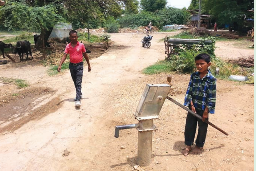
નિષ્ફળ જશે તો જળ સંકટની ગંભીર સમસ્યા સર્જાશે તેવા અંધાણ વર્તાઈ રહ્યા છે.