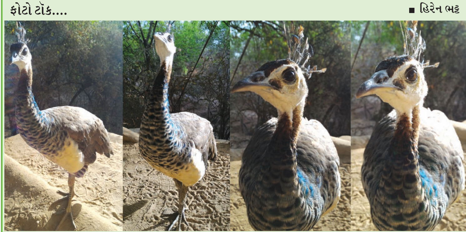
બચ્ચું કોઈનું પણ હોય, એ ખૂબ જ સોહામમું લાગે. એ ગધેડા કે ભૂંડનું હોય તો પણ એ વહાલું જ લાગે…! મોરનું એક બચ્ચું કુતુહલ વશ કેમેરાના લેન્સની સાવ નજીક આવી ગયું… જેમ કોઈ તરુણને મુછનો દોરો ફુટ્યો હોય અને એનો દમામ ચહેરા પર દેખાતો હોય એમ આ બચ્ચું પણ નવી નવી કલગીનો રુઆબ છાંટતું હતું…! મનુષ્યોમાં સુંદરતામાં સ્ત્રીઓની તુલનામાં પુરુષોનું ગજું નહીં, પરંતુ પક્ષીઓમાં એથી ઊલટું છે. હંમેશા નર જ સુંદર હોય. આ બચ્ચામાં પણ એવી જ છટા છલકાતી હતી.

રાષ્ટ્રીય કાનુની સેવા સત્તા મંડળ, દિલ્હી દ્વારા સમગ્ર દેશમાં તા. ૮મી મે, ૨૦૧૬ના રોજ રાષ્ટ્રીય લોક અદાલતનું આયોજન કરવામાં આવ્યું છે. જે અંતર્ગત રાષ્ટ્રીય કાનૂની સત્તા મંડળ અને ગુજરાત રાજ્ય કાનૂની સેવા સત્તા મંડળના માર્ગદર્શન હેઠળ જિલ્લા કાનૂની સેવા સત્તા મંડળ દ્વારા પણ તા. ૮મી મે, ૨૦૧૬ના રોજ જિલ્લા અને તાલુકા કક્ષાની તમામ અદાલતોમાં રાષ્ટ્રીય લોક અદાલતનું આયોજન કરવામાં આવ્યું છે. જે પક્ષકારો કોર્ટમાં દાખલ કરેલ નેગોશીએબલ ઇન્સ્ટ્રુમેન્ટ એક્ટ-૧૩૮ (ચેક રીટર્ન)ને લગતા પેન્ડીંગ કેસોનું સુખદ સમાધાન કરવા ઈચ્છતા હોય તેઓશ્રીએ આ અંગેની વધુ માહિતી માટે જિલ્લા કાનૂની સેવા સત્તા મંડળ, ગાંધીનગર, રૂમ નંબર-૧૦૧, પ્રથમ માળ, ન્યાય મંદિર, સેક્ટર-૧૧, ગાંધીનગરનો સંપર્ક કરવો.