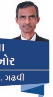
કાણના ચણીબોર વી. ચૈતા. ગઢવી

વસંતનો વાસંતી વૈભવ જ્યારે અલવિદા કહેવાની તૈયારી કરે છે તેવા માર્ય મહિલામાં ડૉક્ટર સાહેબની સ્મૃતિ પુનઃ અનેક લોકોના મનમાં જીવંત થતી હશે. આ મહિલામાં બની રહેલી અનેક પ્રસંગોની ઘટમાળમાં ડૉ. લોહિયાનું સ્મરણ ન થાય તો એ આપણી સામુહિક ખોટ ગણાય તેમ કહેવામાં અતિશયોક્તિ નથી. ઉત્તર પ્રદેશમાં ૧૯૧૦ ના માર્ચની ત્રેવીસમી તારીખે (અખાત્રીજનો દિવસ) આ અલગારી જીવ આપણી વચ્ચે આવ્યો અને એક નિરાળુ અને નિઃસ્વાર્થ જીવન વ્યતિત કરીને ગયા. ૧૯૧૦ થી ૧૯૬૭ સુધીની તેમની જીવનયાત્રા એક સતત સંઘર્ષ તથા વૈચારિક જાગૃતિની અનોખી મીસાલ બનીને નિષ્ઠા અને નિસબત માટેના સંઘર્ષનું અમીટ સ્મારક બની ગયા. ડૉ. લોહિયાની જન્મશતાબ્દીના પ્રસંગે (૨૦૦૮-૨૦૧૦) આપણા જાગૃત પત્રકાર સ્વ.શ્રી દિગંત ઓઝાએ "શતાબ્દી વંદના" ના નામે એક સુંદર પુસ્તકનું સંકલન કરીને પ્રકાશિત કરેલું હતું. ડૉક્ટર સાહેબ સદેહે આપણી વચ્ચે ન હોવા છતાં તેમના વિચારો સાંપ્રતકાળમાં પણ પ્રેરણાદાયક તથા પથદર્શક બને તેવા છે. લોહિયાજીના પરિચયમાં આવેલા અનેક મહાનુભાવો તેમના વિશે