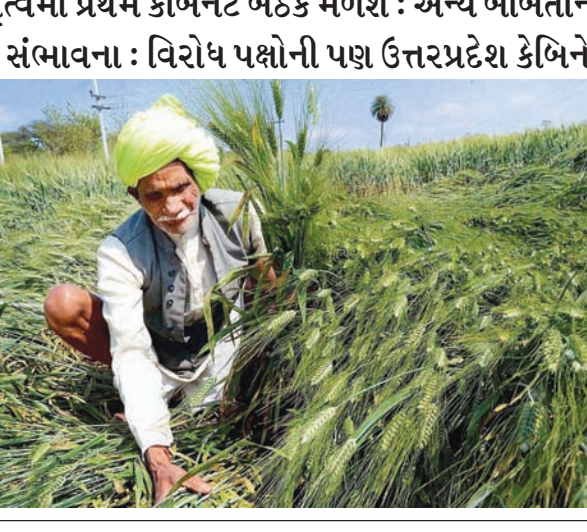
● અનુસંદાન પાન-૭ પર

લખનૌ, તા. ૩ ઉત્તરપ્રદેશના મુખ્યમંત્રી યોગી આદિત્યનાથના જનતા દરબારમાં આજે મુસ્લિમ મહિલા પણ પહોંચી હતી. આ મુસ્લિમ મહિલાએ લગ્ન બાદ તેને થઈ રહેલી તકલીફોનો મુદ્દો ઉઠાવ્યો હતો અને કહ્યું હતું કે તેના પતિએ ફોન ઉપર તેને તલાક આપી દીધા છે. મુખ્યમંત્રીના જનતા દરબારમાં પહોંચેલી આ મુસ્લિમ મહિલા સબરીને કહ્યું હતું કે મુખ્યમંત્રી દ્વારા તેમને ન્યાય મળશે તેમ તેઓ માને છે. યોગી આદિત્યનાથના જનતા દરબારમાં મોટી સંખ્યામાં અન્ય લોકો પણ સમસ્યાઓના નિરાકરણ માટે પહોંચ્યા હતા.