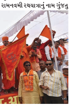
મહેસાણા શહેરની આ ઉદ્દમી રથયાત્રા ભારતીય સંસ્કૃતિને ઉજાગર કરતી અને નવી પેઢીને વારસો પ્રદાન કરે છે. આ રથયાત્રા નિહાળવા મોટી સંખ્યામાં લોકો એકત્રીત થાય છે તેમજ રથયાત્રા જે માર્ગમાંથી પસાર થાય ત્યારે રામચંદ્રજીના દર્શન કરવાનો આસ્થાનો સાગર લહેરાતો જોવા મળે છે. રથયાત્રાના કાર્યમાં યુવાનો અને વડીલોનો સહયોગ બિરદાવવા લાયક હોય છે.

રથયાત્રામાં મહાનુભાવો દ્વારા ધર્મ-ધ્વજ આરોહણ તેમજ રામચંદ્ર ભગવાનની આરતી કરવામાં આવી હતી. નાયબ મુખ્યમંત્રીનું સ્વાગત-સન્માન સેવા સમિતિ દ્વારા કરવામાં આવ્યું હતું.