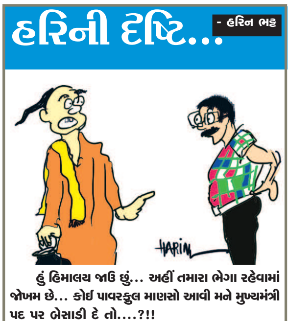
હું હિમાલય જાઉં છું... અહીં તમારા ભેગા રહેવામાં જોખમ છે... કોઈ પાવરકુલ માણસો આવી મને મુખ્યમંત્રી પદ પર બેસાડી દે તો...??!

જ ગુણનું માર્દનીંગ ફિલ્ડનું પુછવામાં આવતા માર્દનીંગ