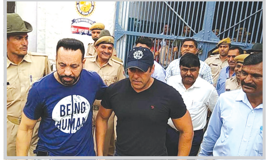
ચુકાદો આવ્યા બાદ સલમાનને તરત જ કસ્ટડીમાં લઈને જેલમાં લઈ જવામાં આવ્યો હતો. અગાઉ વર્ષ ૧૯૮૦ના આ કેસના મામલે

મુક્ત કરવામાં આવ્યો હતો. બીજા બાજુ સલમાનને સજાના મામલામાં બિશ્નોઈ સમાજના લોકોએ કોર્ટમાં આ ચુકાદાને પડકાર ફેંકવા માટે પરની તૈયારી બતાઈ છે. સલમાનને સજા અપાવવાના હેતુસર બિશ્નોઈ સમાજ હજુ લડાયક મુડમાં છે. બિશ્નોઈ સમાજના વકીલ મહિપાલ બિશ્નોઈએ કહ્યું છે કે, અમે સલમાનના મામલામાં વધુ લડત લડવા તૈયાર છીએ. આ ચુકાદાની સામે રાજસ્થાન હાઈકોર્ટમાં રજુઆત કરવાની તૈયારી બિશ્નોઈ સમાજ દ્વારા કરવામાં આવી છે. લેખિત ચુકાદામાં ચીફ જ્યુડિશિયલ મેજિસ્ટ્રેટ ટેવ કુમાર ખન્નીએ કહ્યું છે કે, આરોપી લોકચિત્ર અભિનેતા છે. અત્રે નોંધનીય છે કે વર્ષ ૧૯૮૮ના ક્રાળિયાર શિકાર કેસમાં જોધપુરની કોર્ટે ગુરુવારના દિવસે તેનો ચુકાદો આપી દીધો હતો. કોર્ટે આ કેસમાં બોલીવુડના દબંગ સ્ટાર સલમાન ખાનને દોષિત જાહેર કર્યો હતો અને પાંચ વર્ષની જેલની સજા