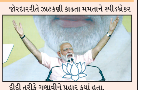
દીટી તરીકે ગણાવીને પ્રહાર કર્યા હતા. ● અનુસંદાન પાન-૭ પર

કુલબિહાર-ઈન્ફાલ, તા. ૭ વડાપ્રધાન નરેન્દ્ર મોદી આજે લોકસભા ચૂંટણીને લઈને આક્રમક ચૂંટણી પ્રચારમાં વ્યસ્ત રહ્યા હતા. મોદીએ આજે પશ્ચિમ બંગાળ, ત્રિપુરા અને મણિપુરમાં ચૂંટણી રેલી કરીને કોંગ્રેસ અને અન્ય વિરોધ પક્ષો ઉપર આકરા પ્રહારો કર્યા હતા. સૌથી પહેલા મોદીએ પશ્ચિમ બંગાળના મુખ્યમંત્રી મમતા બેનર્જીના ગઠમાં ઝંઝાવતી પ્રચાર કરીને મમતા ઉપર પ્રહાર કર્યા હતા. મોદીએ કુલબિહારમાં રેલીને સંબોધતા મમતા બેનર્જી સરકારને