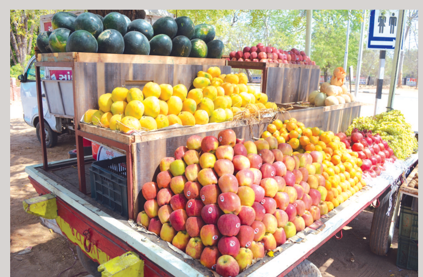
ઉનાળાના પ્રારંભે શાકભાજીની આવક ભલે ઓછી થઈ હોય પરંતુ વિવિધ કળોના આગમનથી બજારો શોભી રહ્યા છે. શરીરને ઈંડક આપતા ફળો જેવા કે તડબુચ, સકરટેટી, સંતરા, દ્રાક્ષ, સફરજન, ચીકુ અને દાડમથી દુકાનો લચી પડી છે. ઉનાળાના આગમનની સાથે જ કેરીઓ પણ બજારમાં દેખાઈ રહી છે. જો કે તેનું પ્રમાણ ઓછું છે. જેમ જેમ ગરમી વધશે તેમ તેમ વિવિધ પ્રકારની કેરીઓથી બજારો ઉભરશે.

ગુજરાતના ગ્રામીણ જીવનના ચિંતક અને એક સમયાન ગુજરાતના મુખ્યમંત્રી રહેલા અણ્ણીએ સત્તામાં આવીને 'મારે ગામડાંનાં અંધારા ઉલેચવા છે' એવું સપનું જોયું હતું. અલબત્ત અહીં એ રાજકારણીની ટીકા નથી પરંતુ ગામડાંનો સાચો પ્રશ્ન સમજીને એમણે ગ્રામીણ ક્ષેત્રે વીજળીકરણ કરવાનો મનસુબો વ્યક્ત કર્યો હતો પરંતુ હજુ સુધી એ શક્ય બન્યું નથી ત્યારે સૌર ઉર્જાનો વપરાશ વધુ થાય તેના પ્રયાસો કરવા જોઈએ. જો આપણે ગામડાંની સાથે જ જોડાયેલો એક પ્રશ્ન વિચારીએ તો સમજાય એવું છે. જેમ કે ગ્રામીણ વિસ્તારમાં ખેતી પર નબત્તા વ્યવસાયીઓ માટેનો સૌથી મોટો પ્રશ્ન છે, ખેતીને વીજળી માટેનો. હવે આ સવાલ સામે તપાસીએ કે વીજળી કેમ જોઈએ ? તો જવાબ હોય ઉભો પાક સૂકાય નહીં એ માટે પાણી પુરૂ પાડવા માટે વીજળી જોઈએ. તો ખેડૂતને પાકને પાણી આપવા માટે વીજળી નહીં પાણી જોઈએ એવો પ્રસ્તુત મળે. બરેબર આમ જોઈએ તો પાકને વીજળી ય નહીં પાણી પણ નહીં બેજ જોઈએ. પાણી ધોરીયા વડે અપાય કે ટપક પદ્ધતિથી કે ફ્વારા પદ્ધતિએ આપીને મૂળ તો જમીનમાં બેજ ટકાવવાનું અગત્યનું છે. આવી નાની પણ અતિ મહત્વની વાત ખેતી અને ખેડૂતની છે તેમ જો સૌર ઉર્જાનો ઉપયોગ કરીએ તો ઘણું સારૂ કામ ગ્રામીણ અને શહેરી ગુજરાતમાં કરી શકાય.