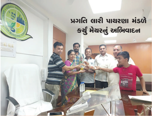
પ્રગતિ લારી પાથરણા મંડળે કર્યું મેયરનું અભિવાદન

પગલે પીઆઈયુ વિભાગના અધિકારીઓને વારંવાર પાણી નીકળવાની નોબત આવતી હતી. પરંતુ આજે ફોલ્ડ મળી આવતા પીઆઈયુ વિભાગના અધિકારીઓએ પાછા પાછા કોલ્ટને અનુભવ્યો હતો. જયારે ગટરની સાફ-સફાઈ કરાવતા તેમાંથી ગલોજ, પાટા-પીડી, નીડલ અને એઈવાડનો કચરો મોટીમાત્રામાં જોવા મળ્યો હતો. સિવિલના સ્ટાફ દ્વારા જ કચરો ગટરમાં ઠલવાતા આ સમસ્યા સર્જાઈ હોવાનું માનવામાં આવી રહ્યું છે. ત્યારે અત્યાર સુધી સિવિલ તંત્ર દ્વારા પીઆઈયુ વિભાગની પામીને