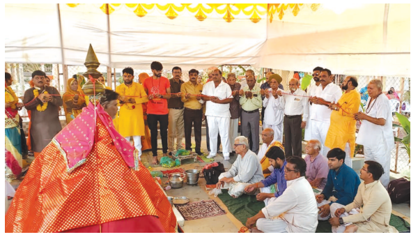
વગડાવાળી ચેહરમાતાના મંદિરે હવન યોજાયો

જાગૃત નાગરિકોએ સહિયારા પ્રયાસથી આગ આગળ વધતી અટકાવી