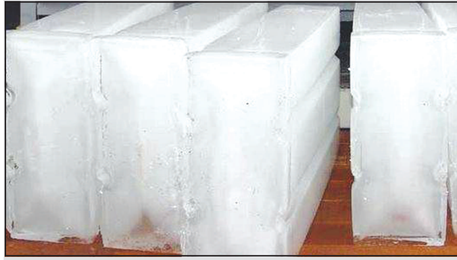
રહ્યા હોય તેમ લાગી રહ્યું છે. એસી, પંખા અને એરકુલર સહિત ગરમીથી નગરનું જનજીવન વેચાણમાં બમણો વધારો જોવા મળે છે. સામાન્ય દિવસોમાં શહેરમાં

ગાંધીનગર, તા. ૧૯ ઉનાળાના પ્રારંભે જ આકાશમાંથી અગનગોળા વરસી પ્રભાવિત બન્યું છે, શહેર બપોરના સમયે સુમસામ બની જાય છે. ગરમીથી રાહત મેળવવા માટે ચીજવસ્તુઓ આરોગી ઠંડક મેળવી રહ્યા છે. ત્યારે ગાંધીનગર શહેરમાં ઉનાળાની સિઝનમાં બરફના