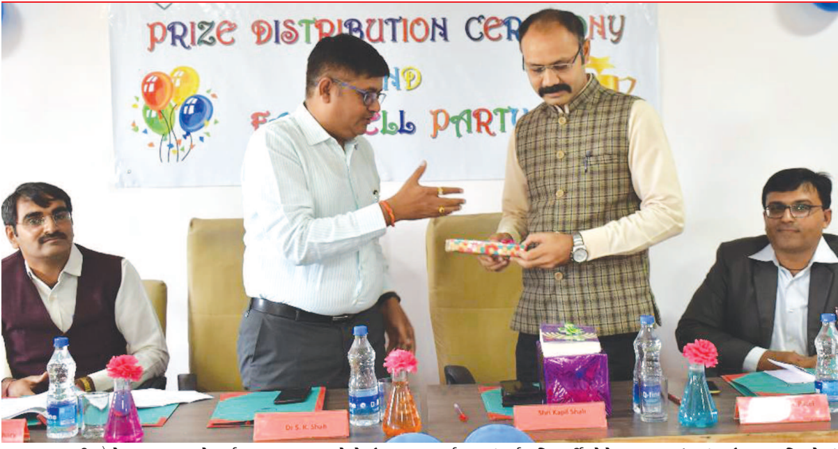
સરસ્વતી કોલેજ, ધણપ ખાતે વર્ષ ૨૦૧૮-૧૯ માટેનો ઇનામ વિતરણ સમારોહ યોજવામાં આવ્યો હતો. સમારોહના મુખ્ય અતિથિ તરીકે નાકોટિક ઇન્સ્પેક્ટર તથા હોમ મિનીસ્ટ્રી ઓફ ઈન્ડિયાના પૂર્વ સેક્રેટરી કવિલ શાહ ઉપસ્થિત રહ્યા હતા.