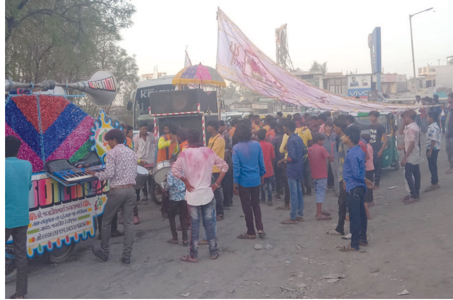
કાંઠા સ્થિત હડકશા માતાજીના મંદિરે દેવીપુજકો ઉમટશે

દર વર્ષે યોજાતા દેવીપુજકોની દેવી હડકાઈ માતાજીના મંદિરે સમગ્ર ગુજરાતમાં વસતા શ્રદ્ધાળુ ભાવિક ભક્તજનો કડા સ્થિત કાંઠા મંદિરે હડકાઈ માતાજીના દર્શનર્થે શીશ નમાવવા અને દર્શનનો લાભ લેવા ચિલોડા પંથકના આજુબાજુ વિસ્તારના દહેગામ, પ્રાંતિજ, અમદાવાદ તેમજ ગાંધીનગર તથા પરપ્રાંતિય દુર વસતા તમામ દેવીપુજકોના ભાગકો, યુવાનો મહિલાઓ, વૃધ્ધો સૌ સાથે માતાજીના ગુણલાં ગાંઠાં હાથમાં હડકાઈ માતાજીની ધજા સાથે વાજને ગાજતે શોભાયાત્રા રૂપે ચિલોડા વાયા મોટી સંખ્યામાં કાળજાળ ગરમીની પરવા કર્યા વિના શ્રદ્ધાના સથવારે પ્રસ્થાન કરી રહ્યા છે. આ સાથે શ્રદ્ધાળુ દેવીપુજકો માટે ચિલોડા-દહેગામ રોડ પર શરબતના ટેન્ડ, ઠંડા પાણી તથા નાસ્તા પાણીની સુવિધાના કેન્દ્રો દ્વારા સેવા આપી રહ્યા છે. આમ કાંઠા સ્થિત શ્રદ્ધાના પ્રતિક રૂપે હડકાઈ માતાના મંદિરે લાખોની સંખ્યામાં માનવ મહેરામણ ઉમટશે અને પોતની મનોકામના પૂરી કરવા શ્રદ્ધાળુઓ તેત્વર બન્યા છે.