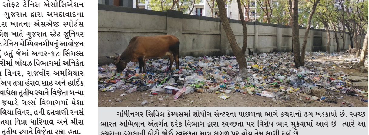
ગાંધીનગર સિવિલ કેમ્પસમાં શોપિંગ સેન્ટરના પાછળના ભાગે કચરાનો ઢગ ખડકાયો છે. સ્વચ્છ ભારત અભિયાન અંતર્ગત દરેક વિભાગ દ્વારા સ્વચ્છતા પર વિશેષ ભાર મુકવામાં આવે છે ત્યારે આ કચરાના ઢગલાની ફોટો જોઈ સ્વચ્છતા માત્ર કાળજી પર હોય તેમ લાગી રહ્યું છે.