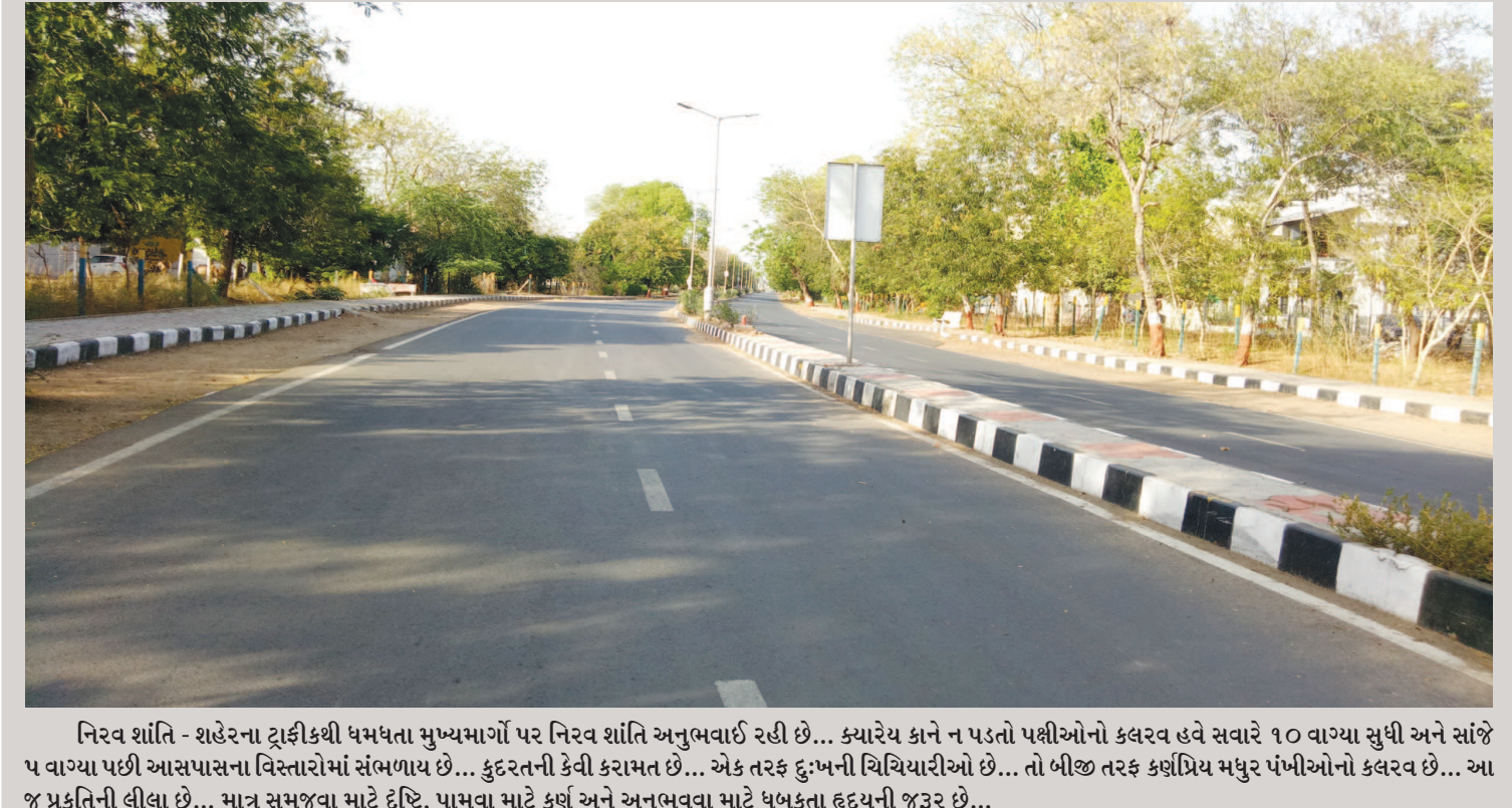
નિરવ શાંતિ - શહેરના ટ્રાફિકથી ધમધમતા મુખ્યમાર્ગો પર નિરવ શાંતિ અનુભવાઈ રહી છે... ક્યારેય કાને ન પડતો પશ્ચિમી બંધારણ હવે સવારે ૧૦ વાગ્યા સુધી અને સાંજે ૫ વાગ્યા પછી આસપાસના વિસ્તારોમાં સંભળાય છે... કુદરતની કેવી કરામત છે... એક તરફ દુઃખની ચિચિયારીઓ છે... તો બીજી તરફ કામગીરી મધુર પંખીઓનો કલ્વર છે... આ જ પ્રકૃતિની લીલા છે... માત્ર સમજવા માટે દષ્ટિ, પામવા માટે કર્ણ અને અનુભવવા માટે ધમધમતા હૃદયની જરૂર છે...

આ બે સેક્ટરોની નજીકના એક-એક સેક્ટરને બફર ઝોનમાં મુકી અને ત્યાંની પરિસ્થિતિ પર ચાંપતી નજર રાખવાનો નિર્ણય મનપાના સત્તાવાળાઓ દ્વારા લેવામાં આવ્યો છે