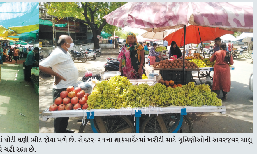
લોકડાઉનમાં જીવન જરૂરિયાતની ચીજવસ્તુઓ ખરીદવા બજારોમાં થોડી ઘણી ભીડ જોવા મળે છે. સેક્ટર-૨ ૧ ના શાકમાર્કેટમાં ખરીદી માટે ગૃહિણીઓની અવરજવર ચાલુ રહે છે. ફળો અને શાકભાજીની ખરીદી માટે લોકો સાવચેતી રાખતા નજરે ચઢી રહ્યા છે.