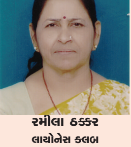
રમોલા ૬૬૬૨ લાયોનેસ ક્લબ