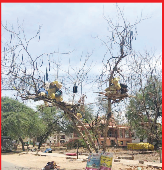
વૈશ્વિક મહામારી કોરોનાએ લોકોની જીવનશૈલી જ બદલી નાંખી છે. શ્રમિકો પોતાના વતન ચાલ્યા ગયા છે. જે અહીં છે તેઓ જેમ તેમ કરીને દિવસો પસાર કરી રહ્યા છે. નગરની બાંધકામ સાઈટો પર કામ કરતા શ્રમિકો વતન ભણી ચાલ્યા ગયા છે. પરંતુ તેમનો સામાન તેઓ વૃક્ષો પર બાંધીને ગયા છે. જે આ તસ્વીરોમાં જોવા મળી રહ્યું છે.