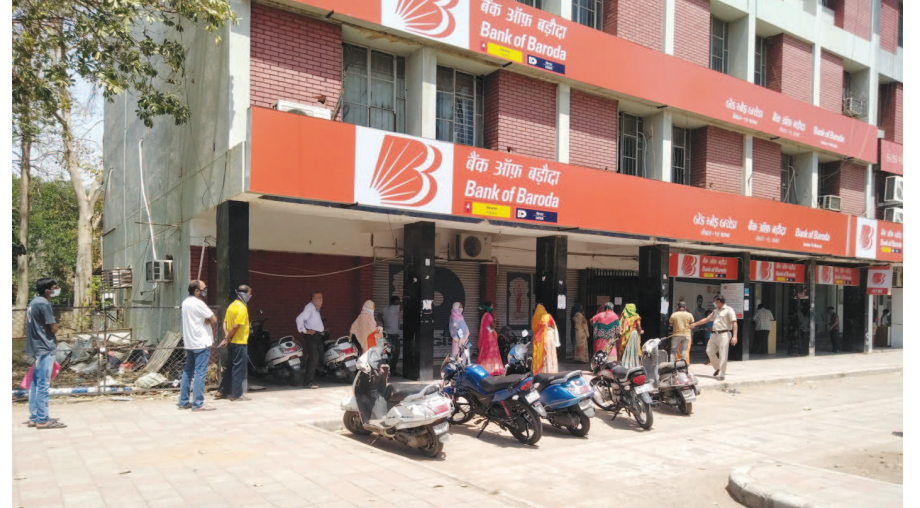
લોકડાઉનના પગલે સરકારે ઘણી બધી યોજનાઓમાં સહાય જાહેર કરી તેની રકમ ખાતમાં જમા કરાવી છે. આ રકમ ઉપાડવા માટે બેંકોમાં લાંબી લાઈન જોવા મળી રહી છે. સોશિયલ ડિસ્ટન્સનું પાલન કરી બેંકોમાં તમામ વ્યવસ્થા ગોઠવવામાં આવી છે.

છૂટછાટ આપવામાં આવે તો જ કેરીનો જથ્થો ગાંધીનગર સુધી પહોંચી શકે બાકી કેરી આવવાના કોઈ ચાન્સ નથી. આ સાથે બીજો પ્રશ્ન એમ પણ છે કે અમુક લોકો એવું માની રહ્યા છે કે કોરોના ફળો અને શાકભાજીથી ફેલાય છે તેથી કેરી ગમે તેટલી હોવા છતાં પણ અમુક દ્વારા ખરીદી પણ નહીં જ થાય તેવું પણ મનાઈ રહ્યું છે. આ બધી બાબતો વચ્ચે શહેરના કેરી રસિયા કેરીની રાહ જોઈ રહ્યા છે અને બીજા બાજુ લાગી રહ્યું છે કે લોકડાઉનના નિર્ણય પરથી જ કેરીનું ભવિષ્ય નક્કી થશે.