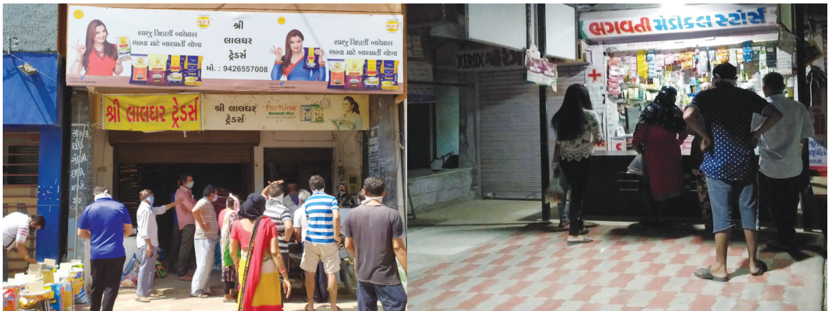
તંત્ર દ્વારા ઉદ્યોગ ધંધામાં થોડી રાહત આપવામાં આવી છે. તેવા સંજોગોમાં કેટલાક વેપારીઓ અને ગ્રાહકો વર્તમાન પરિસ્થિતિની ગંભીરતા સમજવા તૈયાર નથી. સેક્ટર-૨૪ ખાતે આવેલ કરિયાણાની તથા દવાની દુકાનમાં લોકોની ભીડ જોવા મળી હતી કોઈ પણ રીતે સોશીયલ ડિસ્ટન્સિંગ જોવા મળ્યું ન હતું અને વેપારીને એમનો ધંધો કરવામાં જાણે સમય જ ના હોય તે રીતે વર્તન કરી રહ્યા હતા. સરકાર તરફથી છૂટ આપવામાં આવી છે ત્યારે તેનો ઘણી જગ્યાએ દુરુપયોગ થઈ રહ્યો છે.

ચિલોડા પાસે રાજસ્થાન સાવજનિક સેવા ટ્રસ્ટ દ્વારા રોજનો ૧૨ લીલો ઘાસચારો પુરો પાડવું એક ખેતર ભાડે રાખી લેવામાં આવ્યું છે અને સંસ્થાના સ્વયંસેવકો સમગ્ર ગાંધીનગર શહેરના વિવિધ સેક્ટરોમાં ગાડી લઈને ફરી ફરીને ગાય માતાને લીલો ઘાસચારો નીરવાની સેવા પુરી પાડી રહ્યો છે.