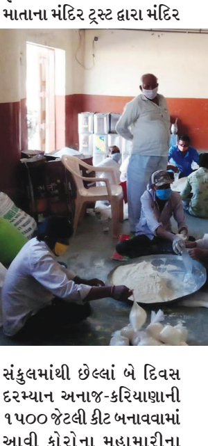
સંકુલમાંથી છેલ્લાં બે દિવસ દરમ્યાન અનાજ-કરિયાણાની ૧૫૦૦ જેટલી કીટ બનાવવામાં આવી કોરોના મહામારીના

ગાંધીનગર, તા. ૨૫ કોરોના વાયરસ સંક્રમણના પગલે દેશભરમાં લાગુ પાડવામાં આવેલા લોકડાઉનને કારણે શહેર હોય કે ગ્રામીણ વિસ્તાર દરેક જગ્યાએ મોટાભાગના વેપાર ધંધા ઠપ થઈ જવા પામ્યા છે જેના કારણે રોજરોજ મજૂરી કરીને કમાઈને રોજરોજ પરિવારનો પેટનો ખાડો પુરતા શ્રમજીવી જરૂરીયાતમંદ વર્ગની હાલત તો અત્યંત મુશ્કેલીભરી બની છે. આ સ્થિતિમાં ગાંધીનગર જિલ્લાના પવિત્ર યાત્રાધામ સમા રૂપાલના વરદાયિની માતાજીના મંદિરેથી ગામના જરૂરીયાતમંદ પરિવારોને અનાજ-કરિયાણાની કીટનું વિતરણ કાર્ય હાથ ધરવામાં આવ્યું છે. ગાંધીનગર જિલ્લાના