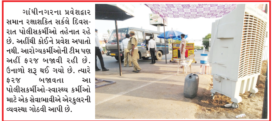
ગાંધીનગરના પ્રવેશદ્વાર સમાન રક્ષાશક્તિ સર્કલે દિવસરાત પોલીસકર્મીઓ તહેનાત રહે છે. અહીંથી કોઈને પ્રવેશ અપાતો નથી. આરોગ્યકર્મીઓની ટીમ પણ અહીં ફરજ બજાવી રહી છે. ઉનાળો શરૂ થઈ ગયો છે. ત્યારે ફરજ બજાવતા આ પોલીસકર્મીઓ-સ્વાસ્થ્ય કર્મીઓ માટે એક સેવાભાવી એરકુલરની વ્યવસ્થા ગોઠવી આપી છે.