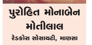
પુરોહિત મોનાબેન મોતીલાલ રેડકોસ સોસાયટી, માહણસા