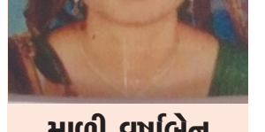
માળી વષભેન રમેશભાઈ રેડકોસ સોસાયટી, માહણસા