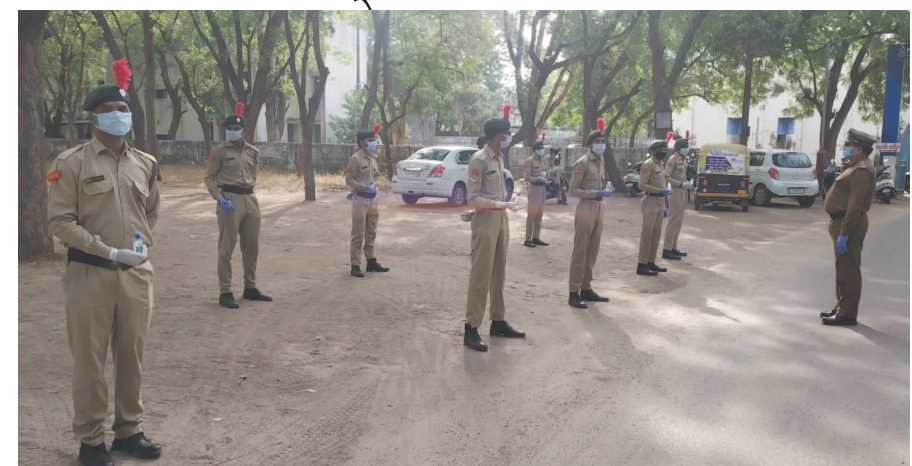
ગાંધીનગર, તા. ૨૫ કોરોના ની મહામારી સામે રાત-દિવસ ફરજ બજાવતા પોલિસ જવાનો ને રાહત આપવા ના હેતુથી ડીજી એન.સી.સી. દ્વારા 'એન.સી.સી. યોગદાન' નામનો કાર્યક્રમ શરૂ કરવામાં આવ્યો છે.

સંકળાયેલ કોલેજ જેવી કે ગવર્નમેન્ટ કોમર્સ કોલેજ, ગાંધીનગર અને શંકરસિંહ વાઘેલા બાપુ ઈન્સ્ટીટ્યુટ ઓફ ટેકનોલોજી, વાસન ના ૧૭ જેટલા એન.સી.સી. કેરેડૂસ વોલન્ટરી જોડાય્યા છે. તા. ૧૩-૪-૨૦૨૦ થી ૧૮/૪/૨૦૨૦ સુધી ૨૧ સેક્ટર પોલિસ સ્ટેશન ના હદ ના વિસ્તારો જેવા કે સેક્ટર ૩૦, ચરેડી, ક-૭, ક-૬, ક-૫ વગેરે જેવા નાકા પુર એન.સી.સી. કેરેડૂસ એક હેલ્પીંગ હેન્ડ તરીકે પોલિસ જવાનો સાથે સેવા બજાવી નાગરિકોને ઘરની બહાર નીકળતા અટકાવવા મા મદદ કરી હતી.