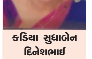
કડિયા સુધાબેન દિનેશભાઈ રેડકોસ સોસાયટી, માહણસા