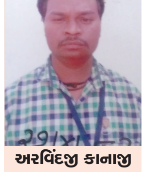
અરવિંદજી કાનાજી ઠાકોર મુક્તિધામ