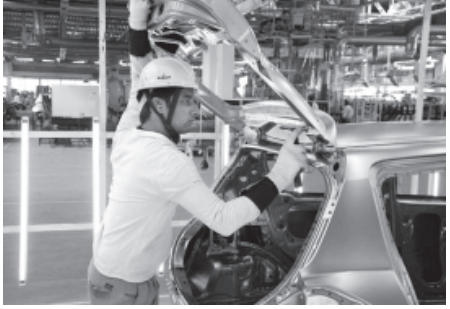
મારૂતિ સુઝુકીમાં કામકાજ શરૂ થઈ છે.

ભારતમાં બળભગાટ મચી ગયો હતો. વ્યાપક હિંસા પ્લાન્ટમાં ભડકી ઉઠ્યા બાદ એક મહિના પછી પ્લાન્ટમાં ફરી કામકાજ શરૂ થવાર થયું છે. કંપનીને આ હિંસાના કારણે લાભો ડોલરનું નુકસાન થઈ ચુક્યું છે. ગુડગાંવ નજીક હરિયાણામાં માનેસર ખાતેની ફેક્ટરીમાં ૫૫૦૦૦૦