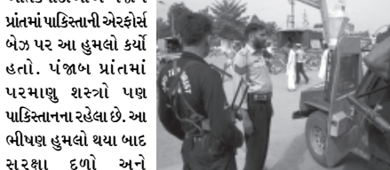
હાઈ એલર્ટની પહેલાંથી જ જાહેરાત થઈ હતી.

દરમિયાન કોંગ્રેસ પ્રમુખ સોનિયા ગાંધી પણ તમામ ઉત્તર-પુર્વીય રાજ્યોના મુખ્યમંત્રી સાથે વાતચીત કરી શકે છે. બેંગ્લોરમાં હુમલાની દહેશત લોકોને સતાવી રહી છે. બીજા બાજુ