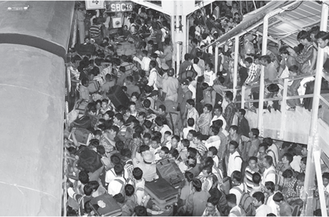
બેંગ્લોરમાં ગઈકાલે એવી અફવા ફેલાઈ ગઈ હતી કે ઉત્તર-પુર્વીય રાજ્યોના લોકોને ટાઈગટ બનાવવામાં આવી શકે છે. ત્યારબાદ બેંગ્લોર શહેરનાં મુખ્ય રેલવે સ્ટેશન ઉપર અફવાતરફી

બેંગ્લોર, તા. ૧૬ બેંગ્લોરમાં હુમલા થવાના ભયથી હજારો લોકો અહીંથી નિકળી રહ્યા છે. ભારે અફવાતરફી રેલવે સ્ટેશન ઉપર પણ જોવા મળી રહી છે. બીજા બાજુ બેંગ્લોરમાં અધિકારીઓનું કહેવું છે કે મોબાઈલ સંદેશોએ મારફતે હુમલાઓની અફવા ફેલાવવામાં આવી રહી છે. ઉત્તર-પુર્વીય રાજ્યોના લોકો ઉત્તર હુમલા થવાની અફવા યાલી રહી છે. મણીપુર, નાગાલેન્ડ, અરુણાચલ અને અન્ય રાજ્યોના વિદ્યાર્થીઓ ઉપર હુમલાની અફવા ફેલાઈ રહી છે. બે ખાસ રેલ ગાડીઓ દોડાવવામાં આવી છે. જેમાં ૪૦૦૦થી વધુ લોકો બેંગ્લોર છોડીને આસામ જતા રહ્યા છે.