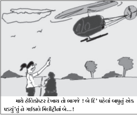
માથે હેલિકોપ્ટર દેખાય તો ભાગજે ! બે દિ' પહેલાં બાપુજી એક પાસડું 'તું' બે ગઈકાલે મિલીટીનાં બે...!